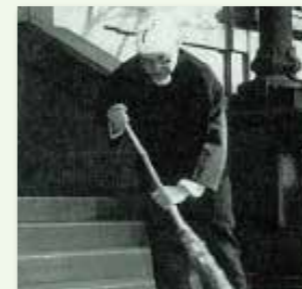
스즈키 세이찌 일본 더스킨 메리메이드 창업주

청소 사업은 누구나 혼자 시작해도 되지 않느냐는 고객의 물음에 나는 이렇게 대답했습니다. “물론이지요. 하지만, 시간과 노력을 대폭 줄일 수 있지요. 우리는 이미 겪은 시행 착오를 바탕으로 시스템상 결점들을 제거했습니다. 왜 처음부터 모든 것을 혼자 다 하려 하세요? 이미 있는 시스템으로 힘차게 출발하는 일만 남았는데요”